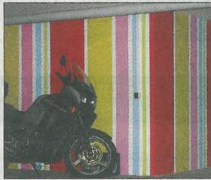
Ungewöhnliche Farb-Akzente findet man auch in der Tiefgarage vor.

»Schöner wohnen unterm Weinberg« – diesen Slogan benutzt er als Arbeitstitel für sein derzeitiges Gesamtprojekt im Metzinger Neubaugebiet. Neben der Amtäckerstraße 50 steht bereits ein weiterer Komplex kurz vor der Vollendung und im Anschluss daran sind weitere Häuser geplant – insgesamt entspricht dies einer Investition in Höhe von zehn bis