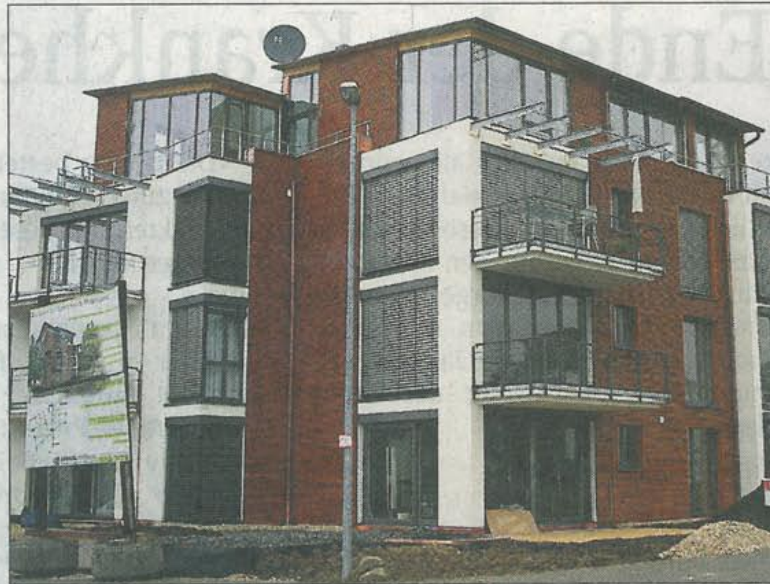
Glas, Lärchenholz und weißer Putz prägen den mediterranen Stil.

zwölf Millionen Euro. Das in rund zehn Monaten unter der planerischen Regie von Architekt Heitho Niemeyer aus Ebersbach realisierte Achtfamilienhaus kostet unterm Strich rund 1,6 Millionen Euro. Die Wohnungen mit zwei bis fünf Zimmern sind zwischen 48 und 160 Quadratmeter groß. Alle-