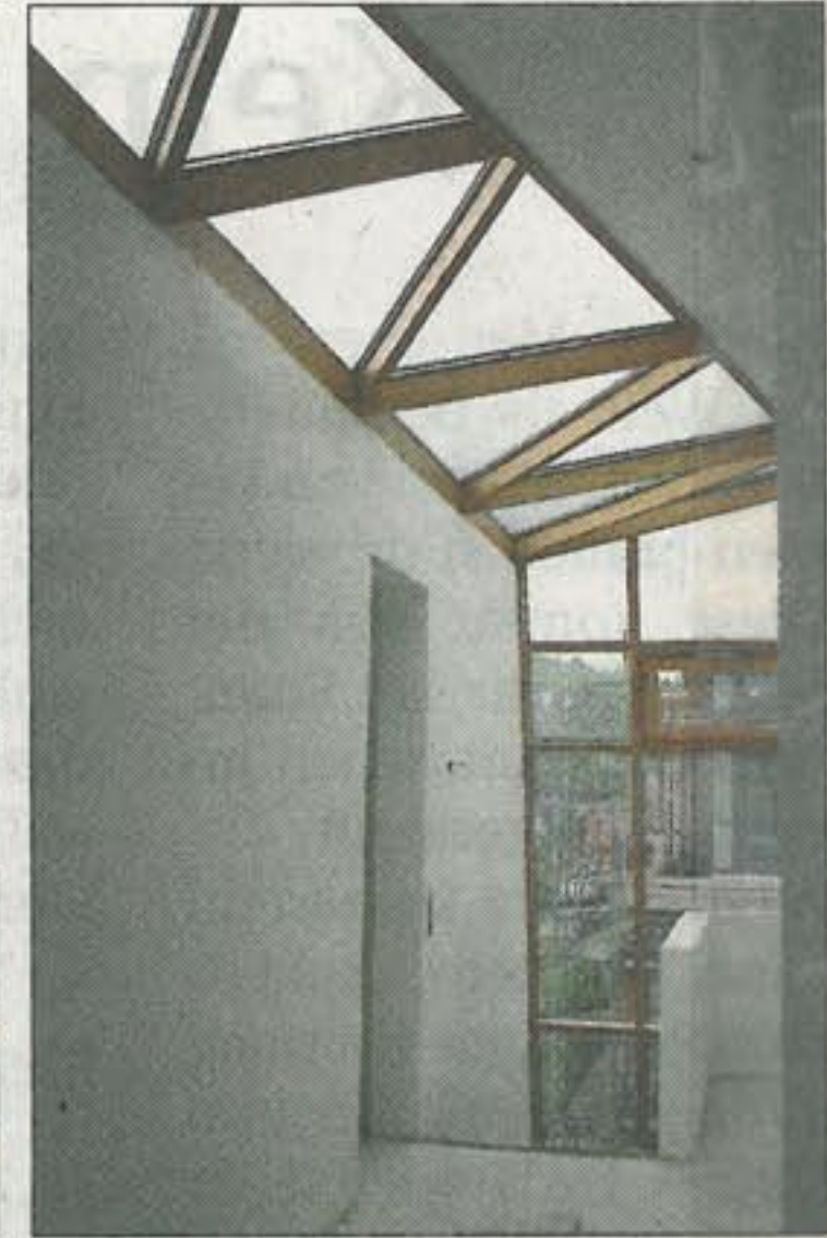
Aufwändige Fenster zuoberst.

von 2,60 Meter, Bäder mit Tageslicht, der Aufzug und das Feinsteinzeug im Flurbereich betonen den Komfort im Haus. (GEA)