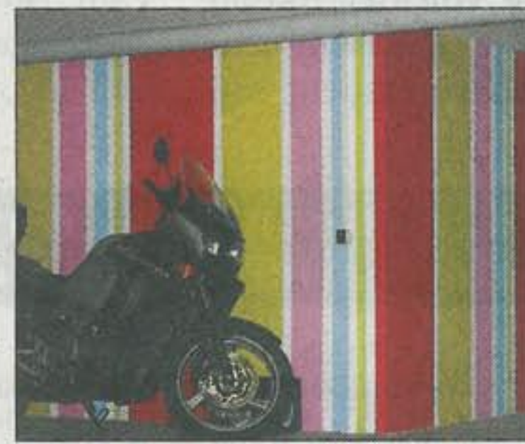
Ungewöhnliche Farb-Akzente findet man auch in der Tiefgarage vor.

»Schöner wohnen unterm Weinberg« – diesen Slogan benutzt er als Arbeitstitel für sein derzeitiges Gesamtprojekt im Metzinger Neubaugebiet. Neben der Amtäckerstraße 50 steht bereits ein weiterer Komplex kurz vor der Vollendung und im Anschluss daran sind weitere Häuser geplant – insgesamt entspricht dies einer Investition in Höhe von zehn bis