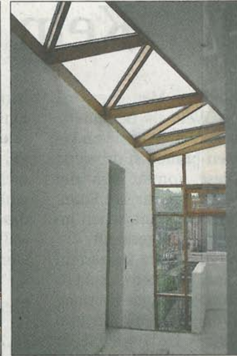
Aufwändige Fenster zuoberst.

von 2,60 Meter, Bäder mit Tageslicht, der Aufzug und das Feinsteinzeug im Flurbereich betonen den Komfort im Haus. (GEA)