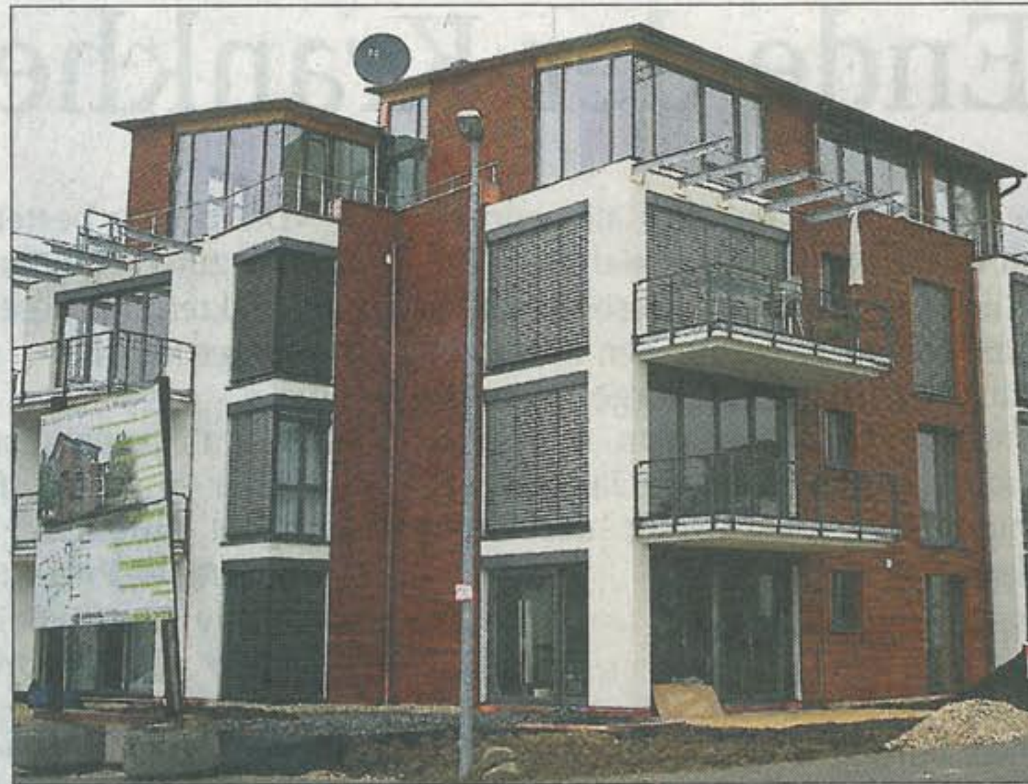
Glas, Lärchenholz und weißer Putz prägen den mediterranen Stil.